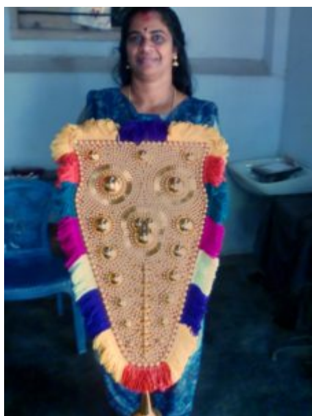
Un ornement de trompe d'éléphant en métal embossé