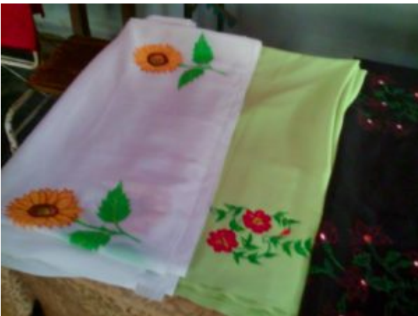
Peinture sur tissu