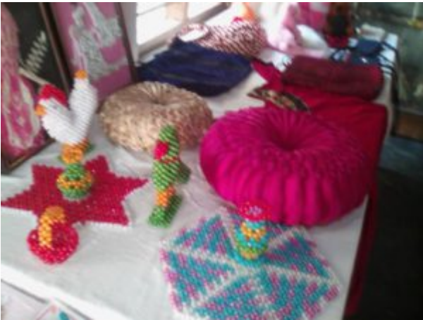
Travaux de perles