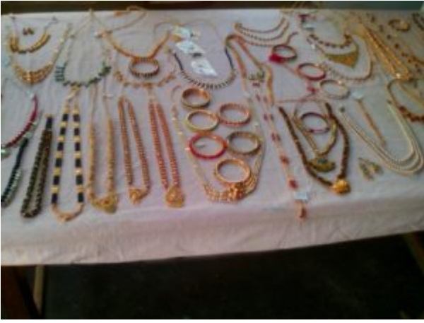
Une partie de la production de bijoux