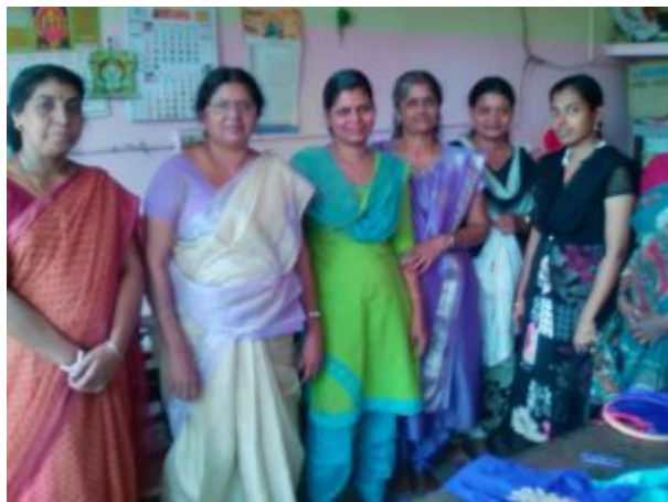
Une partie des stagiaires