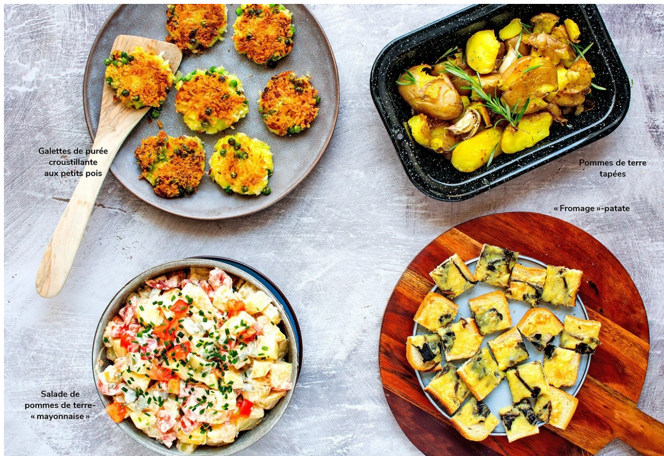
Galettes de purée croustillante aux petits pois