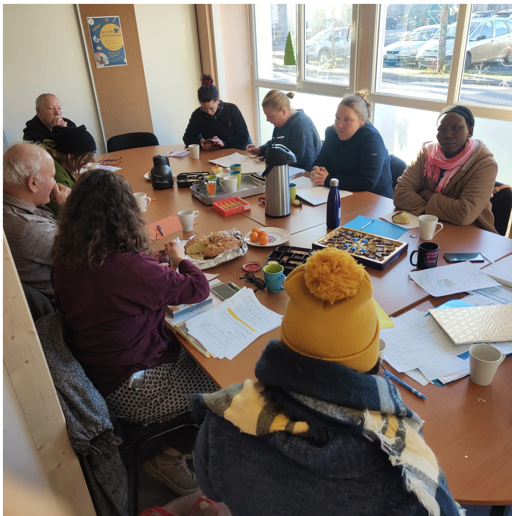
CA de l'Association Décembre 2022

Comment est-ce que vous faites tâches d'huile ? Comment est-ce que vous vous agrandissez, vous touchez plus de monde... ?